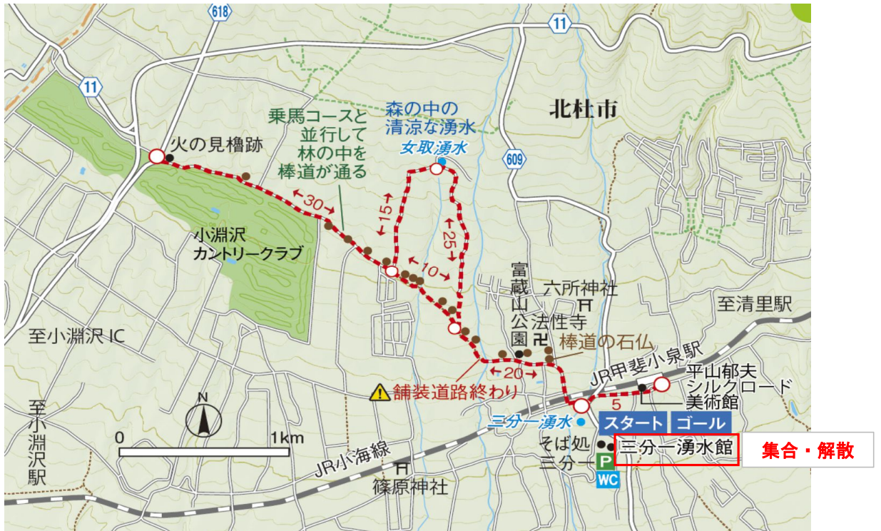
三分一湧水館(集合場所・解散場所)